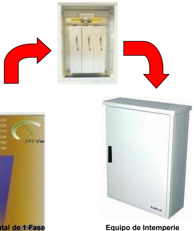
Frontal de 1 Fase